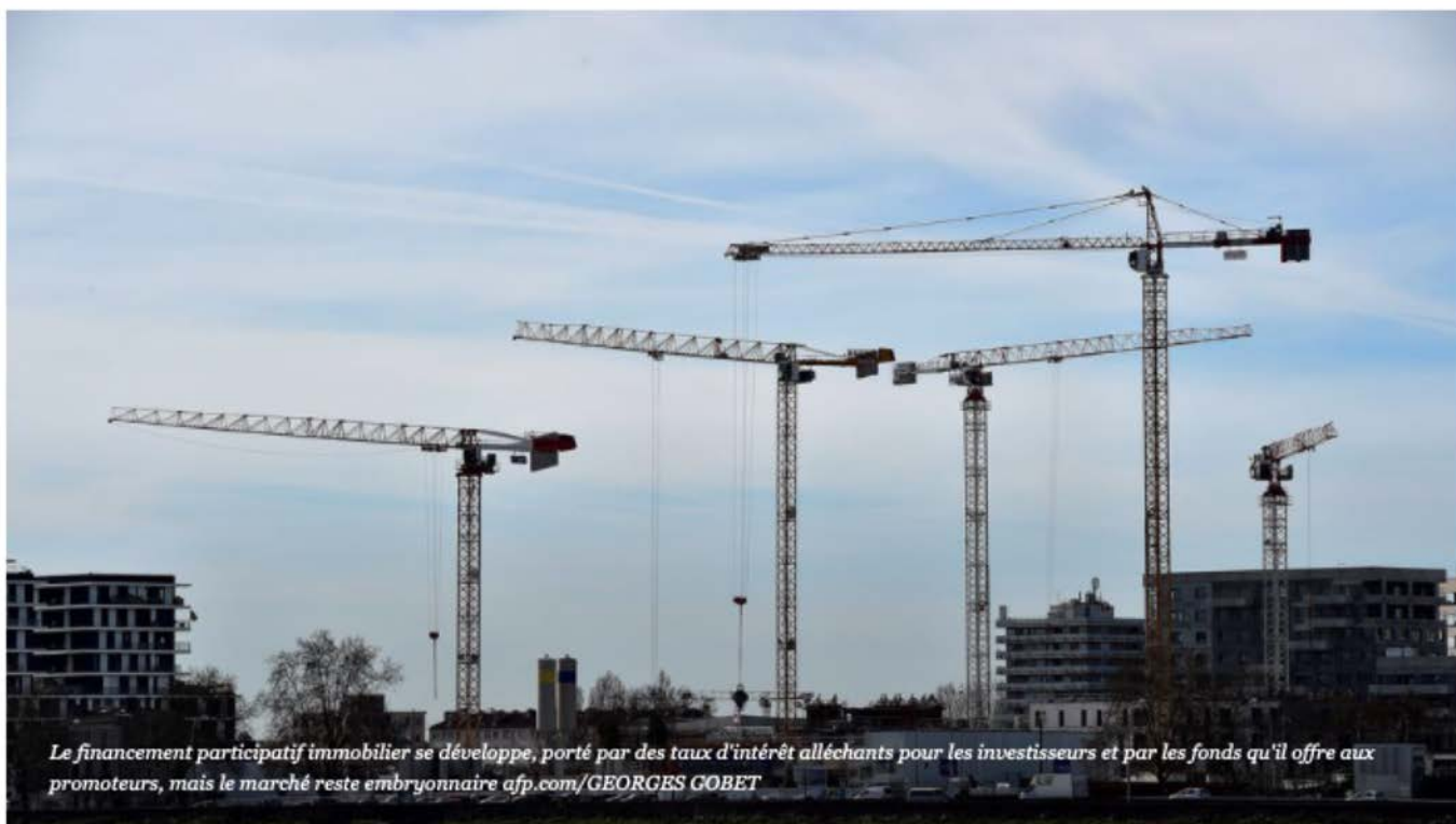
Le financement participatif immobilier se développe, porté par des taux d'intérêt alléchants pour les investisseurs et par les fonds qu'il offre aux promoteurs, mais le marché reste embryonnaire

Paris - Le financement participatif immobilier se développe, porté par des taux d'intérêt alléchants pour les investisseurs et par les fonds qu'il offre aux promoteurs, mais le marché reste embryonnaire.